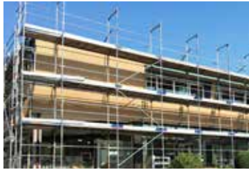
Neugestaltung der Fassade Deggendorf

Wie bereits auf Seite 2 angedeutet, gehen mit der Einführung unseres Logos auch diverse Umbau- und Renovierungsarbeiten einher. Neben den Fassaden und Zufahrtsbeschilderungen, die sukzessive mit dem neuen Erscheinungsbild ausgestattet werden, ist aktuell auch die Galaausstellung am Standort Deggendorf an der Reihe. Die Neueröffnung unseres Showparks ist für das Frühjahr 2017 geplant.