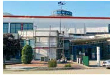
Neugestaltung der Fassade Seidewinkel