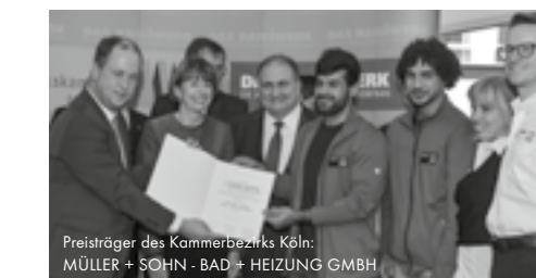
Preisträger des Kammerbezirks Köln: MÜLLER + SOHN - BAD + HEIZUNG GMBH

Die kürzlich von der Koalition festgelegten Eckpunkte für ein neues Einwanderungsgesetz könnte die Zuwanderung qualifizierter Handwerkskräfte enorm erleichtern.